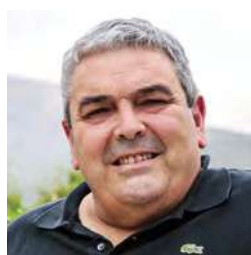
D. Esteban Ibarra presidente del Movimiento contra la Intolerancia