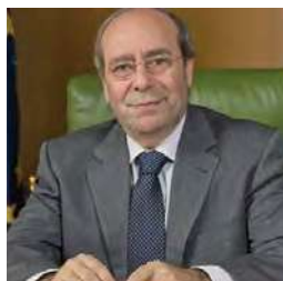
D. Manuel Robles Delgado Alcalde del Ayuntamiento de Fuenlabrada (Madrid)