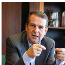
D. Abel Caballero Álvarez Alcalde de Vigo y Presidente de la Federación Española de Municipios y Provincias (FEMP)