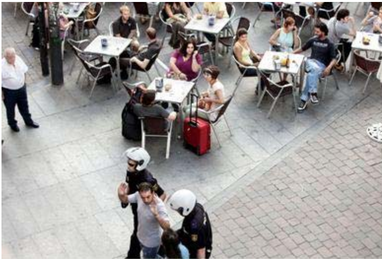
La policía detiene a una persona migrante en la céntrica plaza de Tirso de Molina, Madrid, junio de 2010.

“Quiero que la gente sepa que nosotros los migrantes no somos números. Tenemos el mismo corazón, dos manos, lo mismo que las personas que trabajan por todo el mundo.”