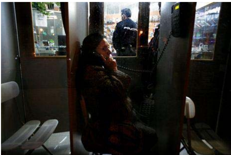
Policía nacional en un locutorio del barrio de Usera, Madrid, enero de 2011.

El representante de un sindicato policial dijo a Amnistía Internacional: “Si tienes que identificar a extranjeros, a cualquiera que te da pie a pensar que es extranjero, vas a ir donde lo pillas”. 28