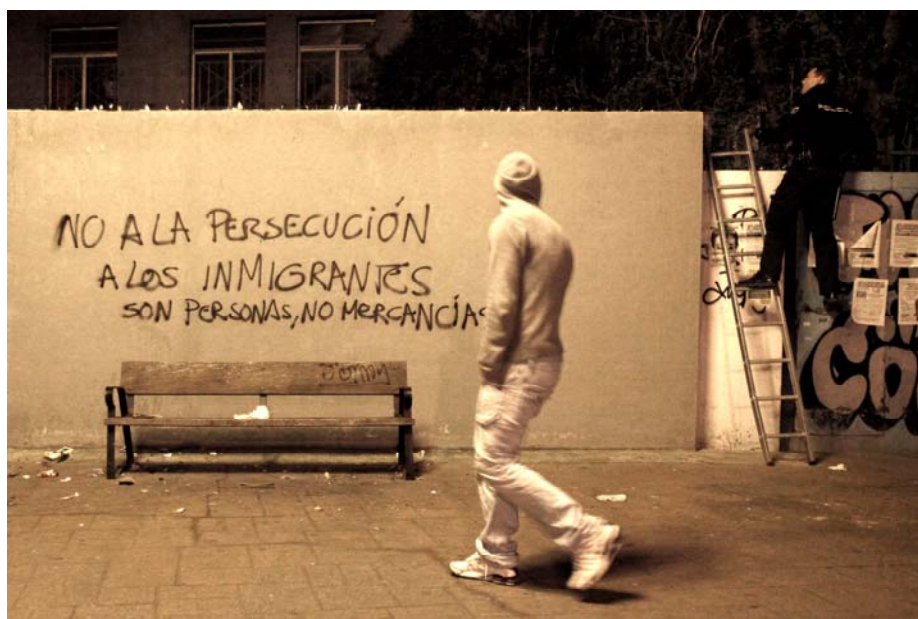
Pintada en un muro del madrileño barrio de Usera, marzo de 2010.

Comunicado de la Asociación de Sin Papeles de Madrid, mayo 2010