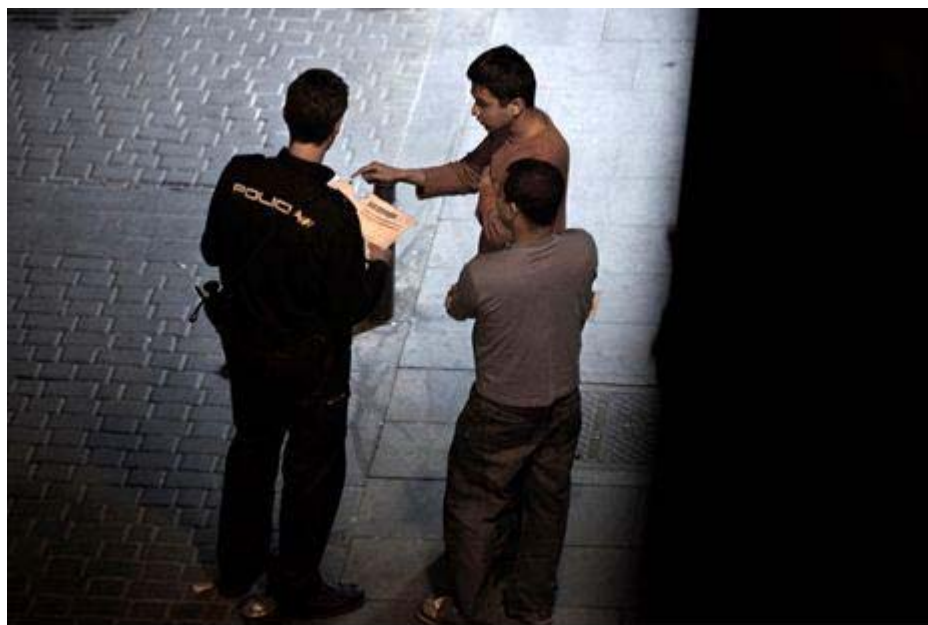
Control de identidad en el barrio de Lavapiés, mayo de 2010.

A pesar de estas garantías, la investigación realizada por Amnistía Internacional ha llevado a la conclusión de que las personas pertenecientes a minorías étnicas siguen siendo elegidas para controles de identidad por su etnia.