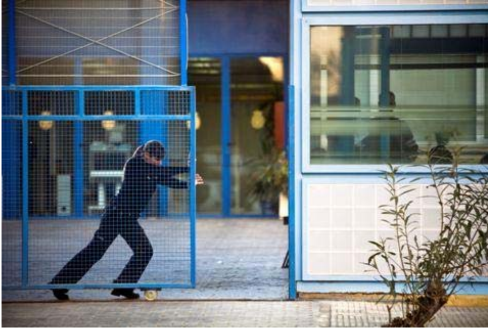
Centro de Internamiento de Extranjeros (CIE) en la Zona Franca de Barcelona, enero de 2011.