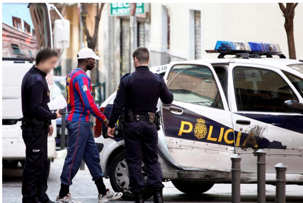
Un hombre de origen subsahariano es conducido a comisaría, barrio de Lavapiés, Madrid, abril de 2010.

Esta forma de “detención preventiva” de una persona que ha aportado documentos de identidad no es ni una detención a efectos de identificación ni una detención preventiva sin cargos. Según Inmigrapenal, grupo de profesores y expertos en derecho penal, la “detención preventiva” de personas que han acreditado su identidad no tiene habilitación legal, contrariamente a lo dispuesto en el artículo 17.1 de la Constitución española, el artículo 9 del Pacto Internacional de Derechos Civiles y Políticos y el artículo 5.1 del Convenio Europeo de Derechos Humanos. 50