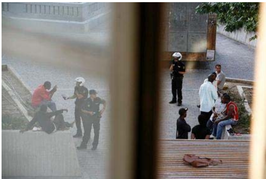
La policía realiza un control de identidad de personas migrantes en la céntrica plaza de Tirso de Molina, Madrid, junio de 2010.